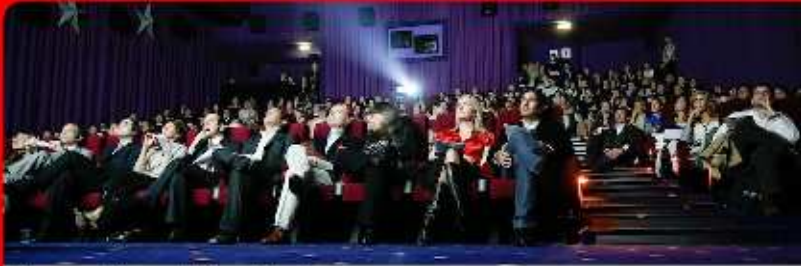
Presentación en el Village Recoleta