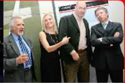
Lanzamiento en Galería Maman